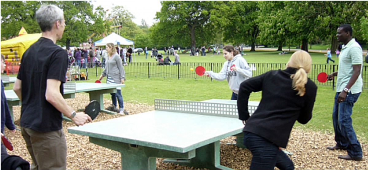
Abbildung 1. Tischtennis im Freien.

Als Beispiel verwenden wir Outdoor-Tischtennistische aus der Geschichte “Zürich ist der coolste Ort in der Schweiz zum Tischtennispielen (laut OpenStreetMap 😊)”